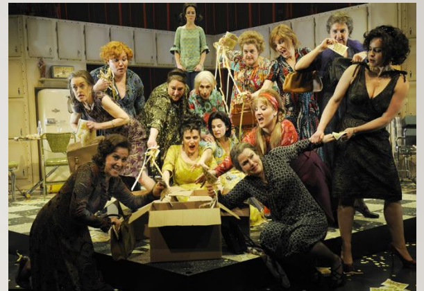
Les Belles-Sœurs, encore jouées en comédie musicale (ici au Centre du théâtre d'aujourd'hui à Montréal en 2010)

Mon travail de maturité, Comparaison de «Les Belles-Sœurs» de Michel Tremblay et de «La nef des sorcières» (collectif): image des femmes et contexte historique , traite de deux pièces de théâtre qui ont été écrites à huit ans d'intervalle (1968 et 1976). Ces deux pièces ont la particularité que les personnages sont uniquement des femmes qui parlent de leur situation de femmes. Le but a été de donner au lecteur un aperçu des changements politiques et sociaux dans les années 60 et 70 au Québec sur le plan de l'image et de la condition de la femme. Est-ce possible de remettre les œuvres dans le contexte historique? Quelles sont les différences et les ressemblances entre les œuvres?