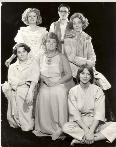
La nef des sorcières, 1976 (première représentation)