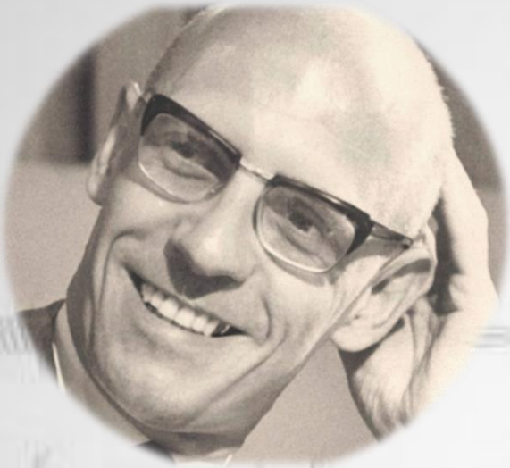
Michel Foucault (1926-1984)