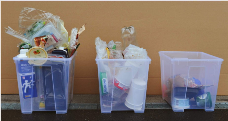
Die Kunststoffmenge der drei Teilversuche

Kunststoff wird zur Bedrohung für die Menschen, die Tiere und unsere Umwelt. Die Reduktion des Kunststoffverbrauchs ist darum dringend notwendig